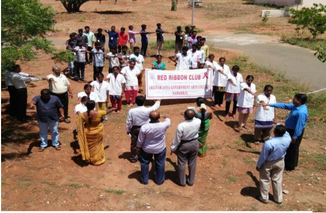
Pledge taken by Students