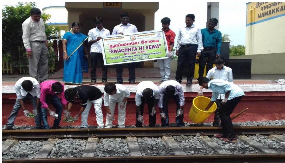
YRC, RRC and NSS Volunteers' from II B. Sc., Chemistry Students (Tamil Medium and English Medium), Arignar Anna Government Arts College, Namakkal was cleaned Namakkal Railway Station with Swachhta Hi Seva Programme.